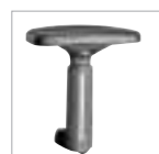
Accoudoirs multifonction (sauf pour version en bois)