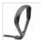
Accoudoirs en anneau